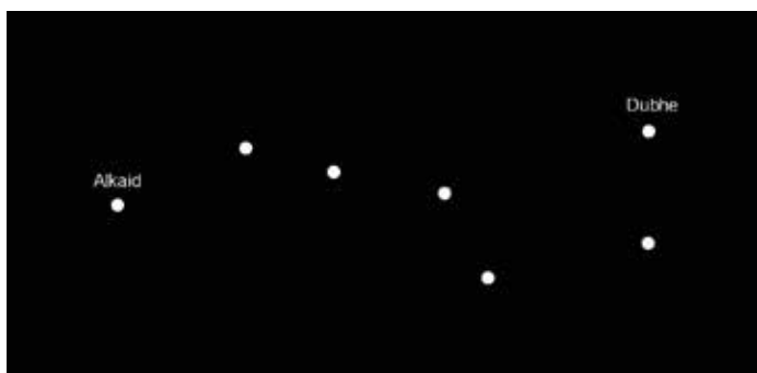
La Grande Ourse.

A suivre dans le prochain numéro : quand le Soleil a rendez-vous avec la Lune.