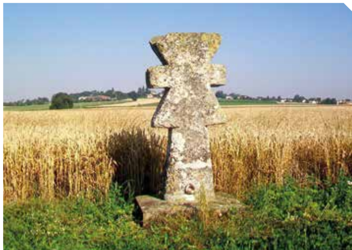
La croix de la Croisette à Guiry-en-Vexin.

Aujourd'hui, on en recense vingt-deux dans le Parc Régional du Vexin.