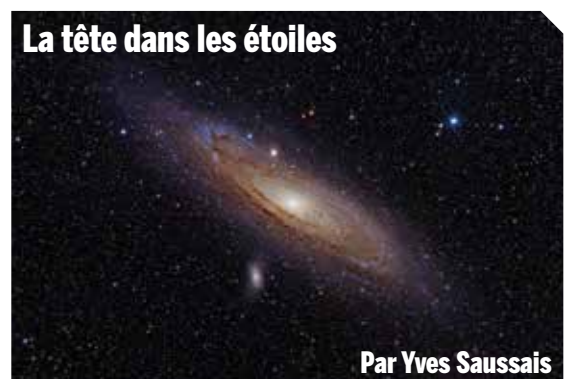
La tête dans les étoiles