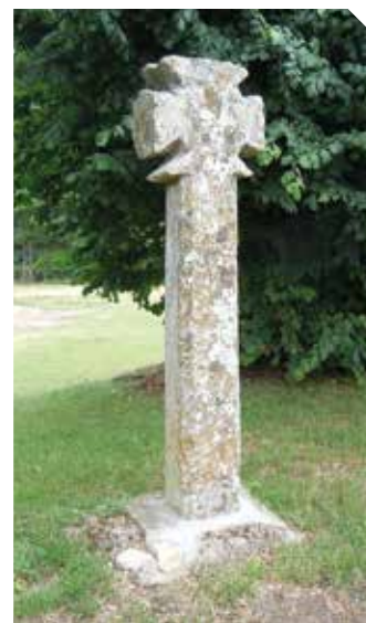
La croix Labathe, de Courcelles-sur-Viosne.