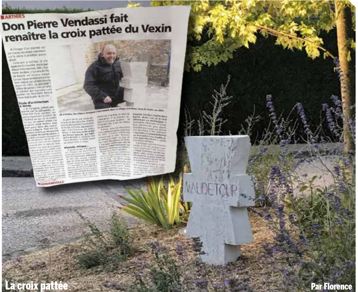
La croix pattée