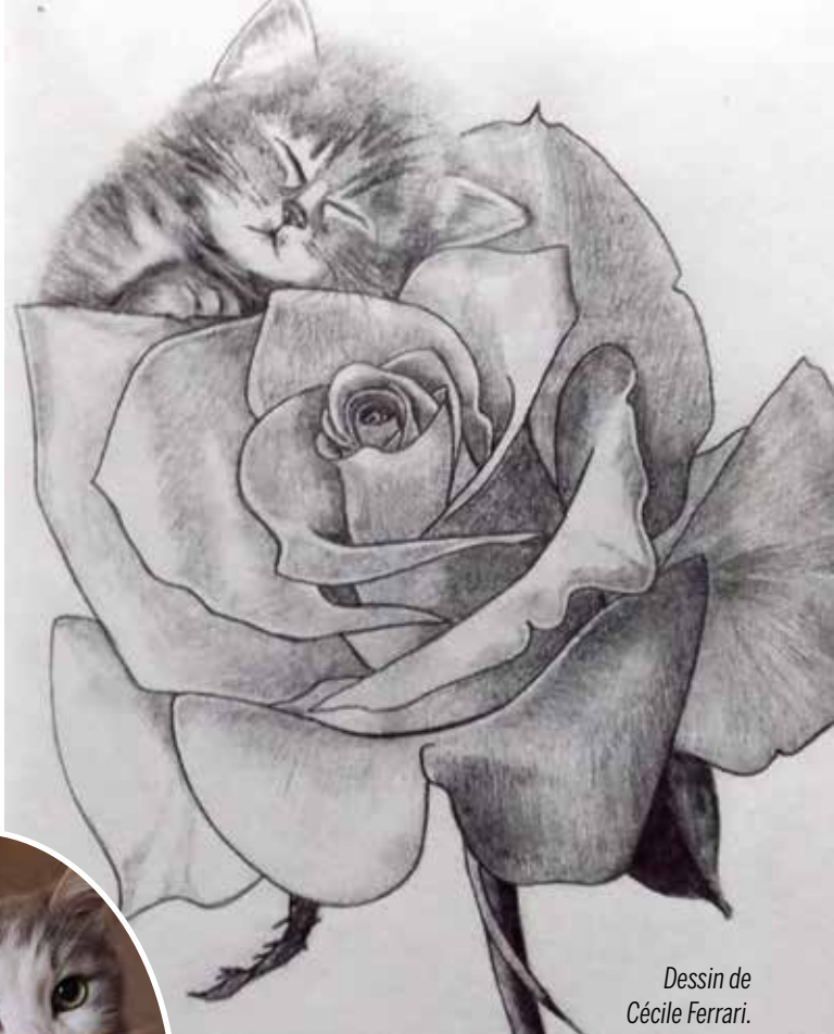
Dessin de Cécile Ferrari.

- Eh bien oui, à merveille! En cas de menace extérieure, j'en suis bien certaine, ils feraient front! Solidarité oblige, ils