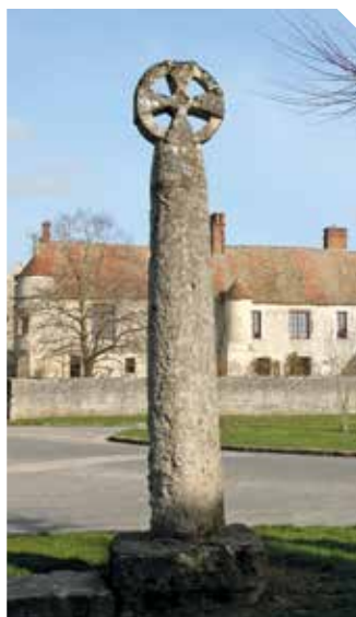
La croix Fromage, d'Omerville